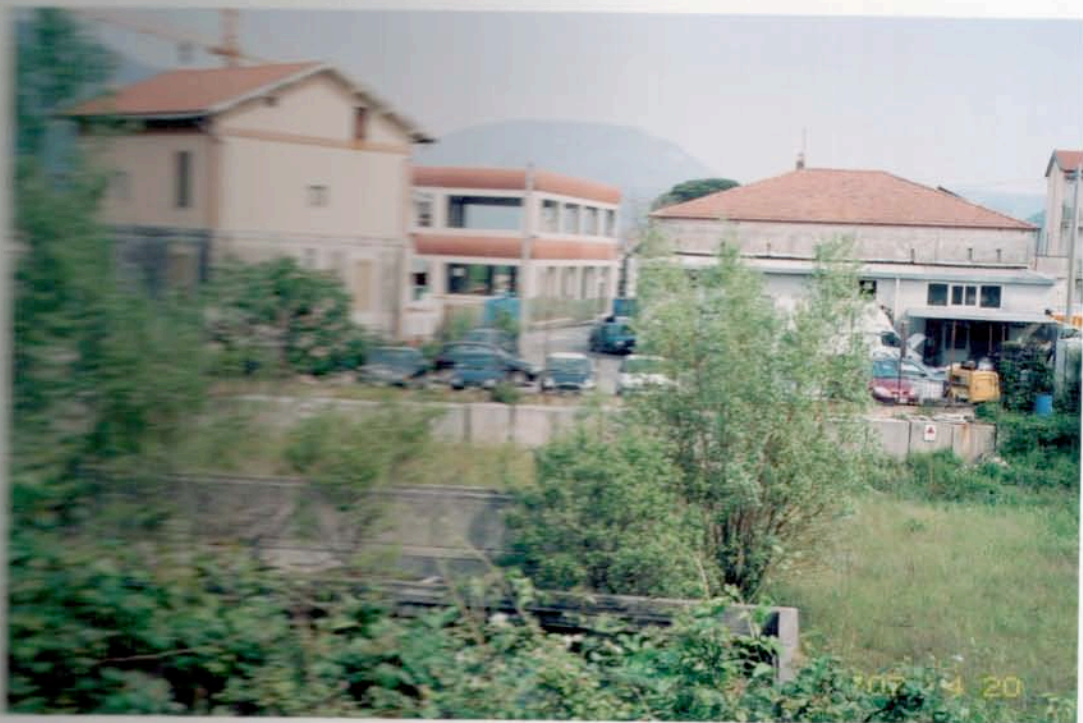
Foto 2 : Muro in culsi di cemento al confine NO della part. 908 fol. 6 di Fiesinno